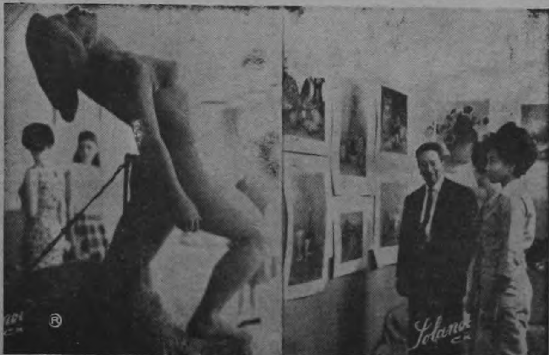
En el edificio de la Universidad de Costa Rica, ubicado en el Barrio González Lahmann, en donde se celebra la exposición de Bellas Artes, nuestro fotógrafo captó estas escenas, significativas por sí mismas. En el orden usual, una magnífica escultura, plena de vida y feminidad, signo de

la pujanza de nuestra raza, a la izquierda, un grupo de visitantes admira un panel de acuarelas. La explosión máxima expresión del movimiento artístico nacional, ha alcanzado relieves sorprendentes este año.