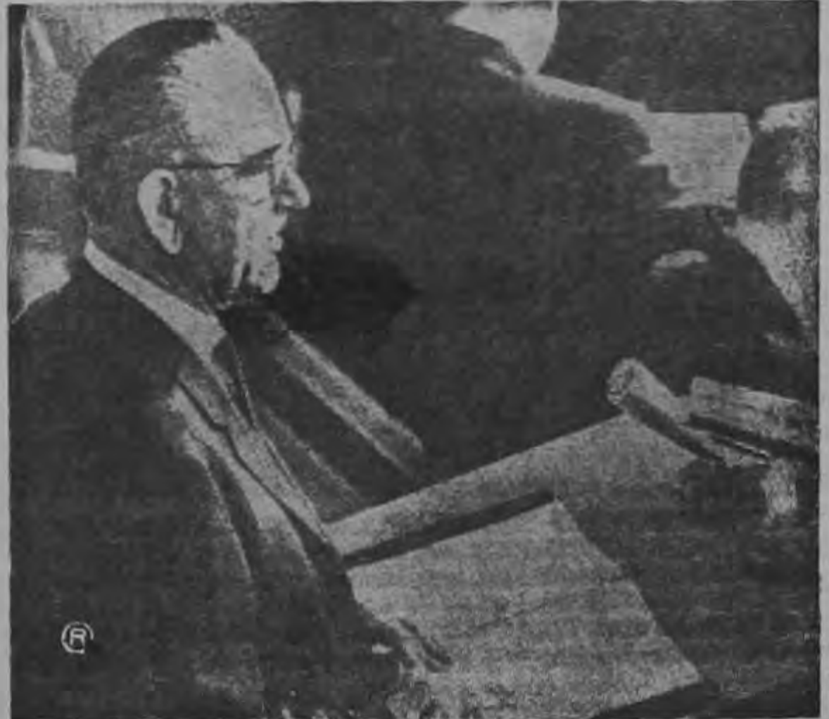
El Presidente Lyndon Johnson, que tomó posesión de su cargo inmediatamente después del asesinato del Presidente Kennedy, se dirigió hoy a su pueblo con motivo de la Celebración tradicional del Día de dar Gracias en los Estados Unidos. Ratificó que el camino seguir en el trazado por el antecesor, preclaro estadista desaparecido, en política nacional e internacional.

"Pero el terror —concluye el diario— cuando no se destruye a sí mismo sólo puede prometer más terror".