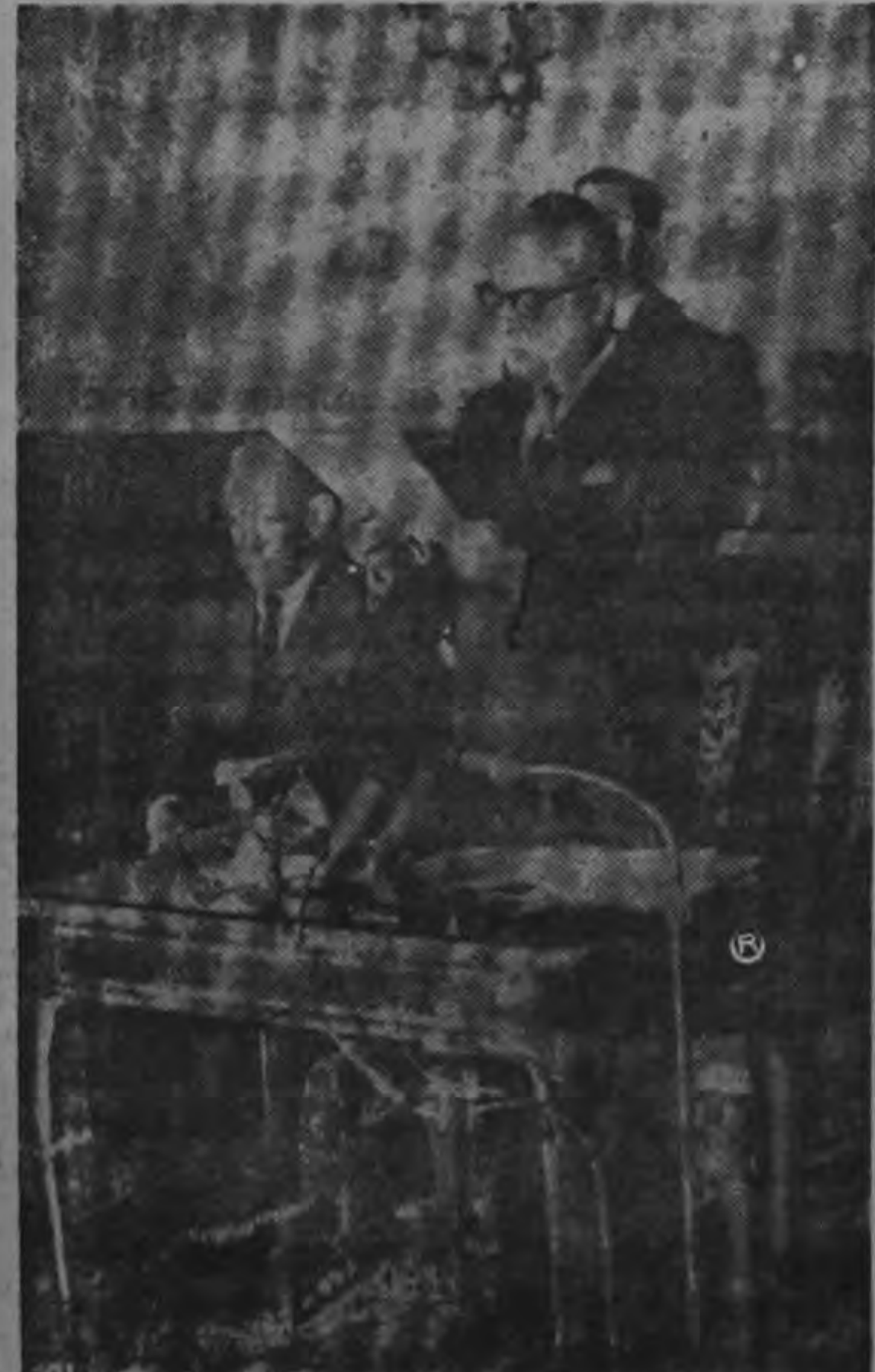
El Presidente de Venezuela Rómulo Betancourt, en una de sus alocuciones al pueblo venezolano, que hoy se encuentra sometido a la acción terrorista de las Fuerzas castrcomunistas que pretenden derrocar al gobierno legítimamente constituido. Las elecciones de Venezuela serán el 1° de diciembre.

"El gobierno democrático, frágil como es en América Latina, ha sufrido varios revéses en los últimos meses. Venezuela bajo Betancourt prometía demostrar que los males sociales de que se alimenta el comunismo podrían ser remediados por reformas democráticas. Sería desastroso si el territorio de una infima minoría hiciera que el país regresara al gobierno autorizado".