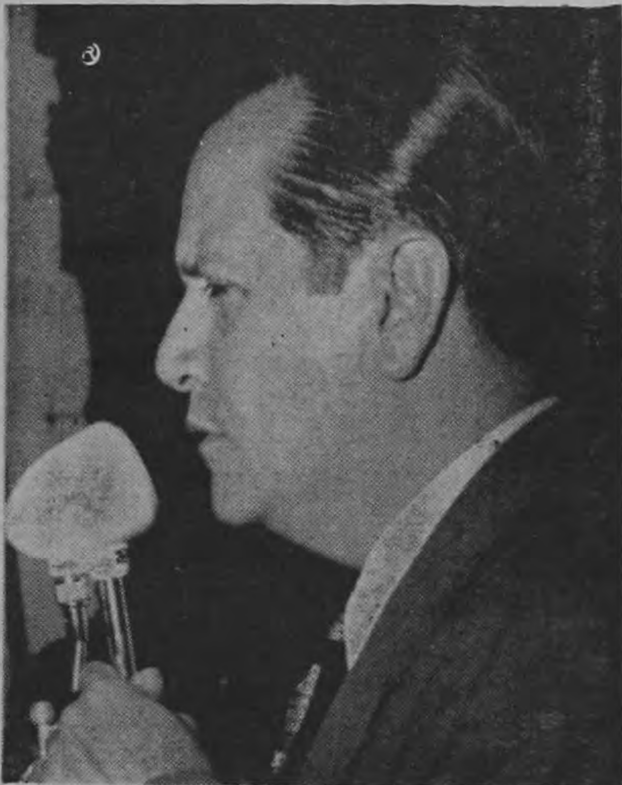
Dr. RAFAEL CALDERA

En agosto de este año, la IX Convención de COPEI, lanzada por tercera vez, su candidatura a la Presidencia de la República. Su campaña electoral está sustentada por dos consignas básicas: 100.000 casos por año y el subsidio familiar. Su lema: EL MEJOR.