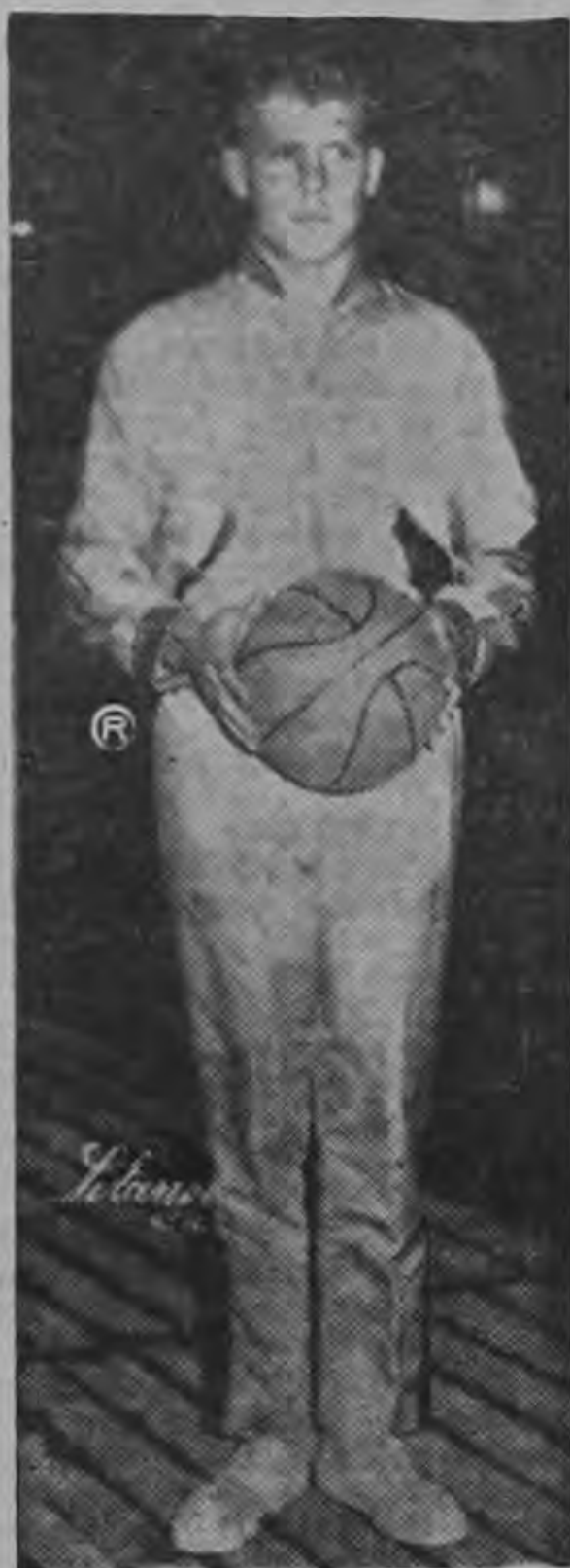
FRED PESCOD ... muy destacado ...

A todo esto, el equipo de los Estados Unidos de América, había triunfado en la competencia de quintas quedando México en 2º lugar y Venezuela en 3º y también en las parejas representados por Jim Schroeder y Bus Oswalt con un total de 2,449 pines en 12 líneas (204 de promedio). En 2º y 3er. lugar